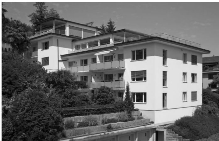
Wohnliegenschaft Seestrasse, Thalwil

Allokationen erfolgen in Bestandsliegenschaften mit nachhaltigen Ertragsperspektiven sowie in Bestandsliegenschaften mit Entwicklungspotenzial (Modernisierung, Verdichtung, Umnutzung). Zusätzlich beinhaltet das Portfolio Investitionen in Neubau- und Entwicklungsprojekte.