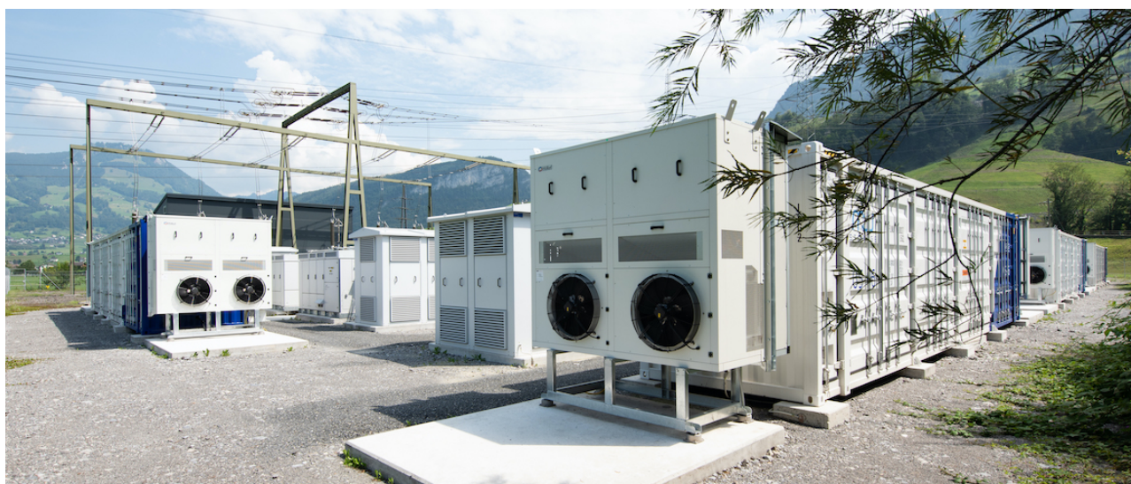
Energiespeicher: Batterie der MW Storage AG in Ingenbohl mit einer Leistung von 20 Megawatt.

Zudem hat sich die VALYOU im Vorjahr an einem Infrastrukturfonds beteiligt, der in moderne und innovative Olivenölplantagen in der Toskana investiert. Er stellt qualitativ hochstehendes und zertifiziertes BIO-IGP-Olivenöl her. Das Projekt ist komplett nachhaltig und die Biodiversität sichergestellt. Zusätzlich trägt die Bepflanzung von Olivenbäumen zur Absorption von CO 2 bei. Das Projekt hat sich im Berichtsjahr sehr positiv entwickelt und die Renditeerwartung liegt bei 10 % p. a.