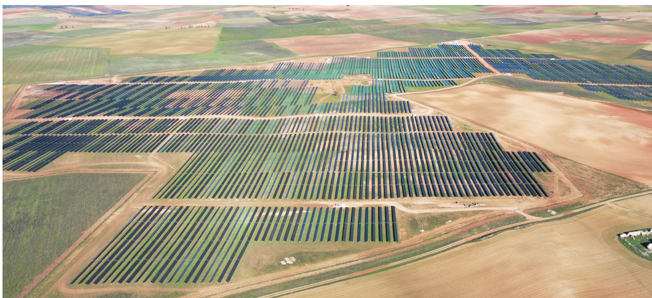
Solarpark: "Villanueva Uno" in Castilla La Mancha, Spanien. 80'000 Module mit einer Gesamtleistung von 50MWp.