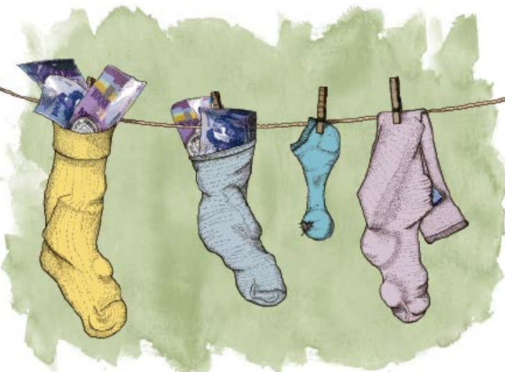
ILLUSTRATION: CLAUDIO KÖPPEL

Der Zinsentscheid sei eine Abwägung zwischen Verteilung auf die Versichertenkonten und Stärkung von Reserven und Deckungsgrad, beschreibt Stohler. Bereits festgelegt hat sich die Sammelstiftung Vita, die dem Ver-